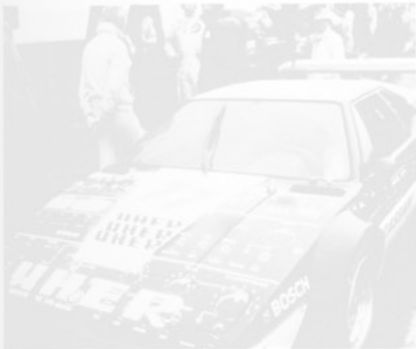
Sorgte für Furore in der ProCar-Rennserie: Uher-geschmückter BMW M1.

Die Uher-Tausender sollen jetzt seinem flotten Vorankommen in der Formel II Europameisterschaft nützen; an Titelgewinn ist dabei freilich nicht zu denken. Nicht nur die renommierte Konkurrenz