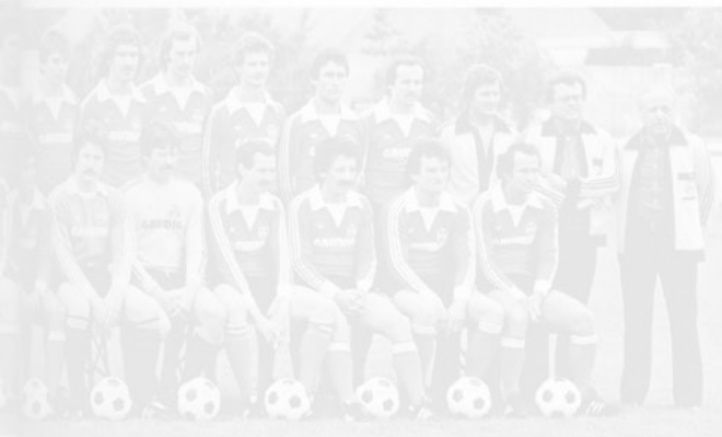
Treten für Geld und Grundig den Ball: Kicker des 1. FC Nürnberg.